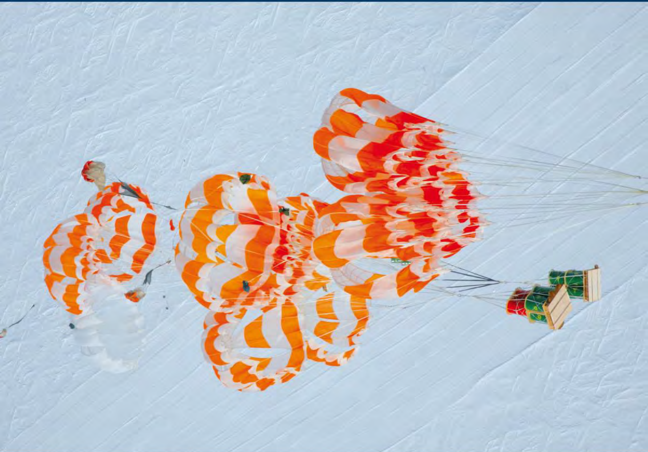
Парашютное десантирование с использованием самолета ИЛ-76 ТД успешно применяется для обеспечения станции «Восток» дизельным топливом.