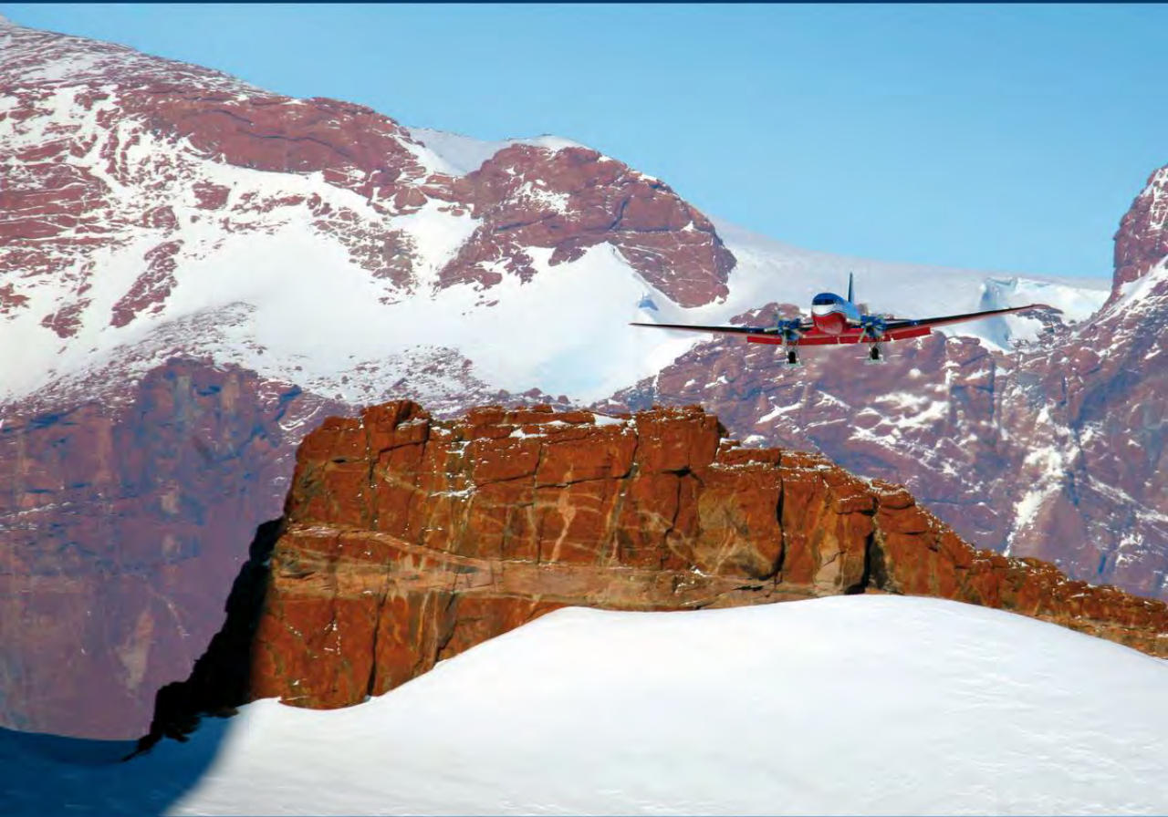
Двухмоторный самолет «Bassler» BT-67 способен нести 2500 кг груза или 18 пассажиров. Максимальная дальность полетов составляет 2000 км, максимальная скорость—300 км в час.