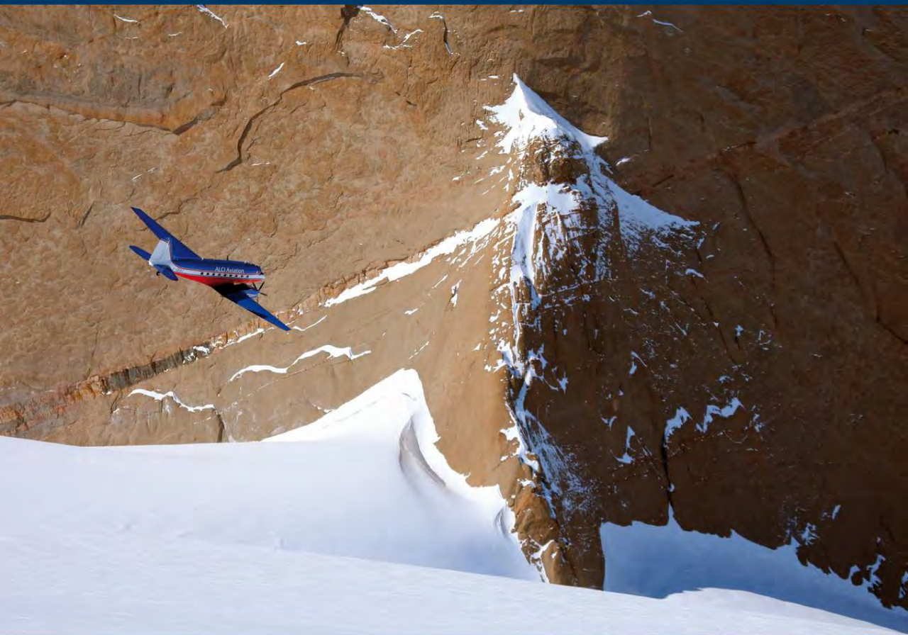
Для внутриконтинентальных перелетов используется в том числе самолет DC-3 BT-67 «Bassler» на лыжных шасси.