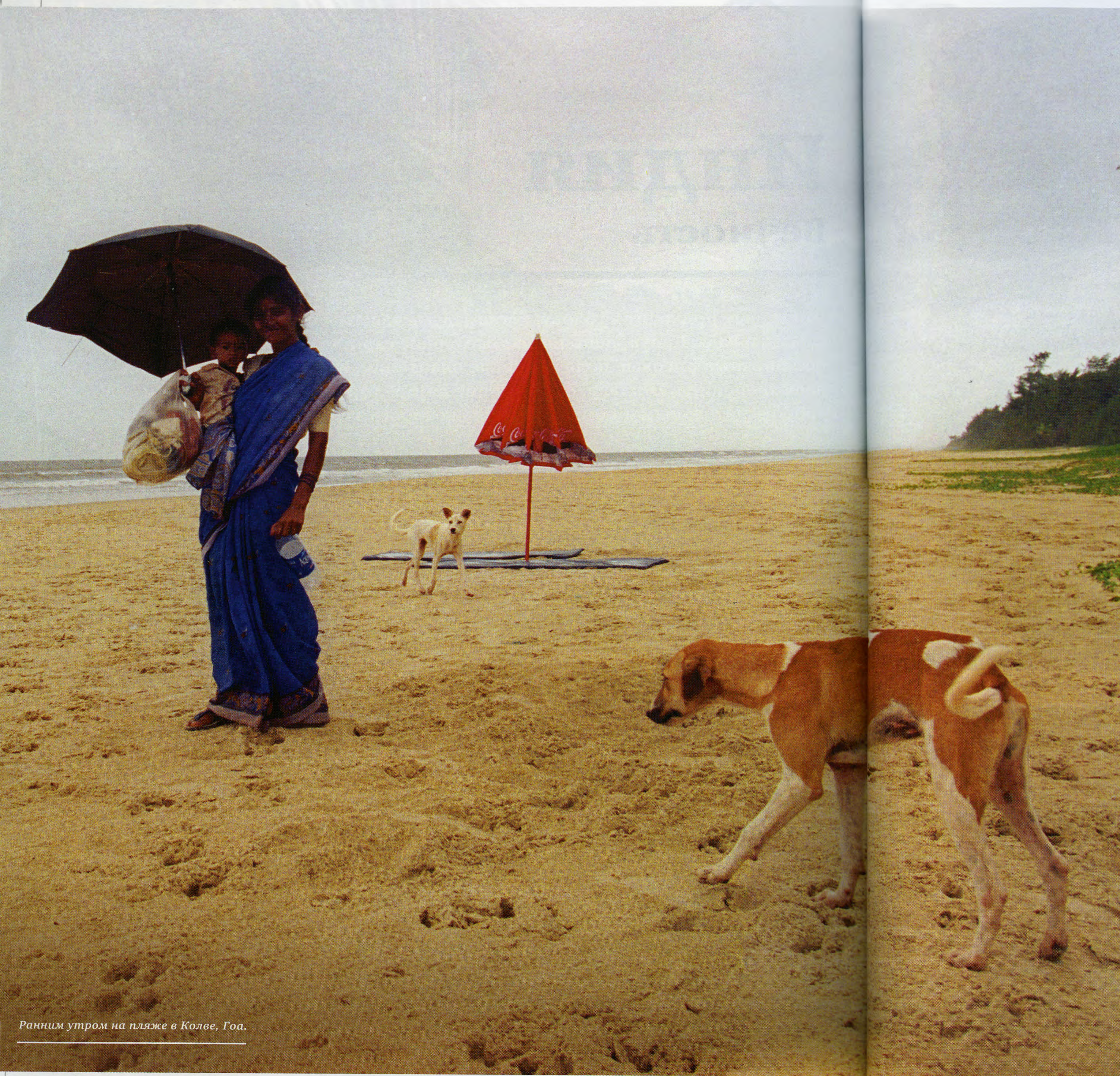
Ранним утром на пляже в Колве, Гоа.