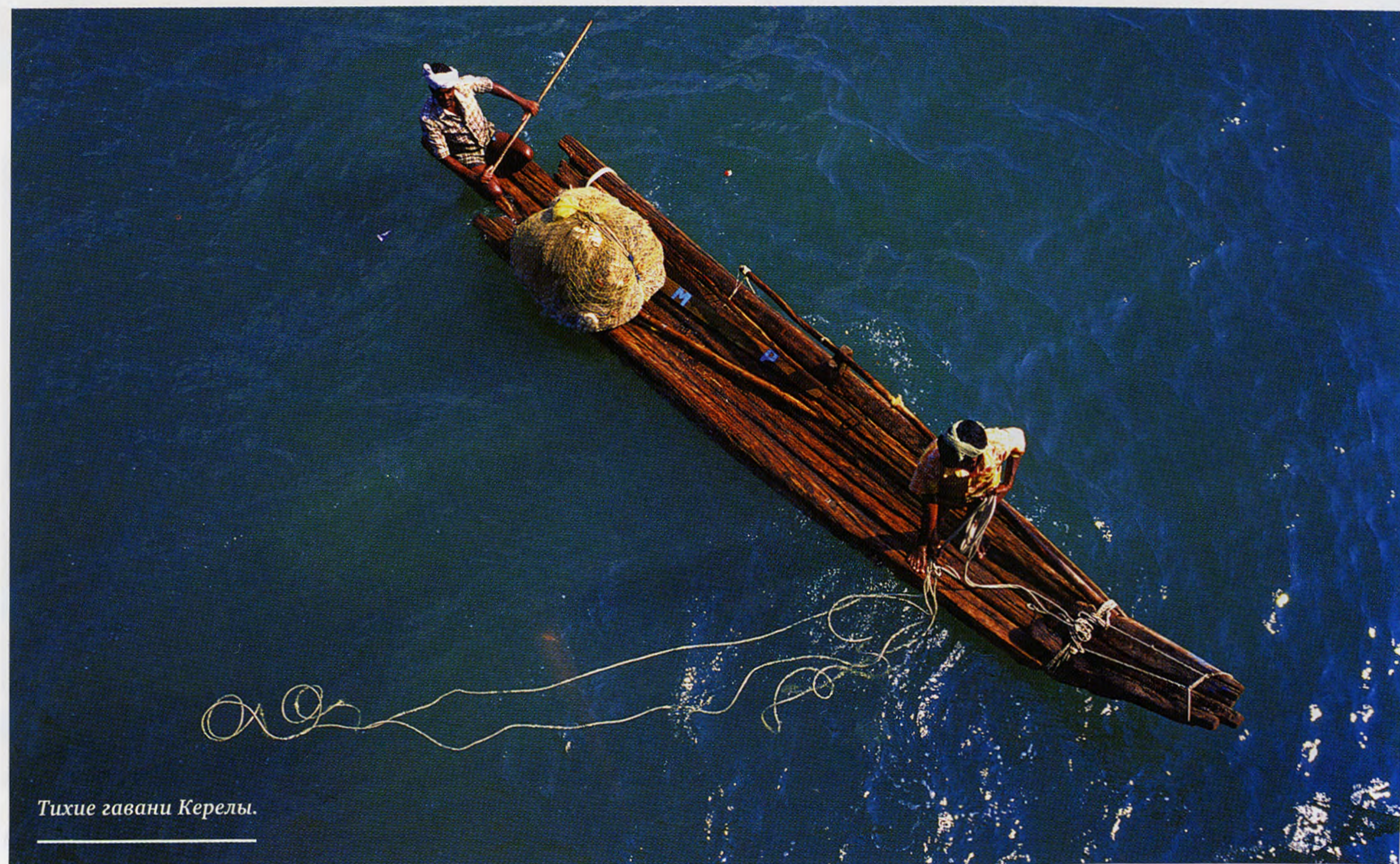
Тихие гавани Керелы.