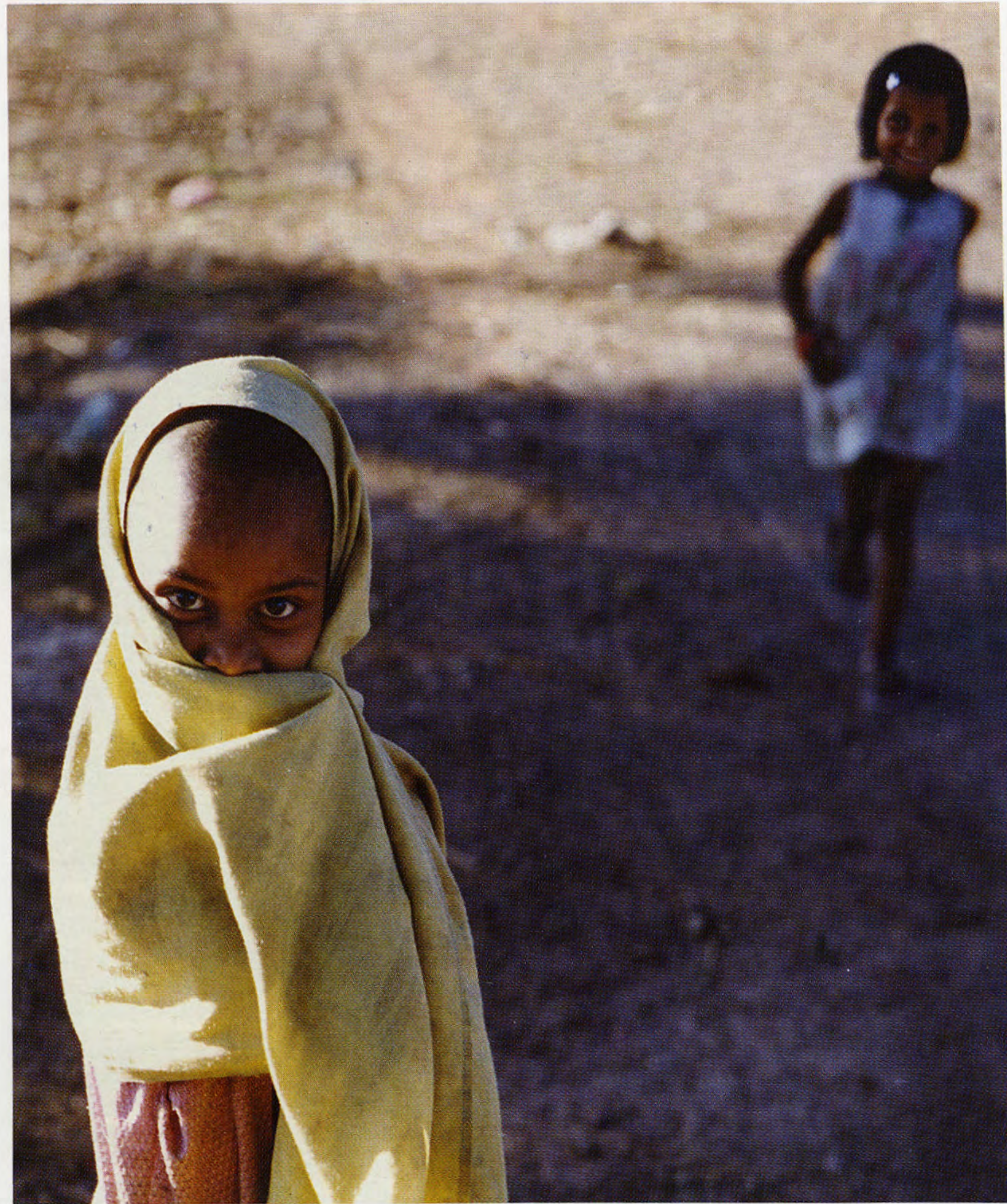
Разнообразие лиц и культур зачастую поражает, но все жители Индии очень терпимо относятся друг к другу.