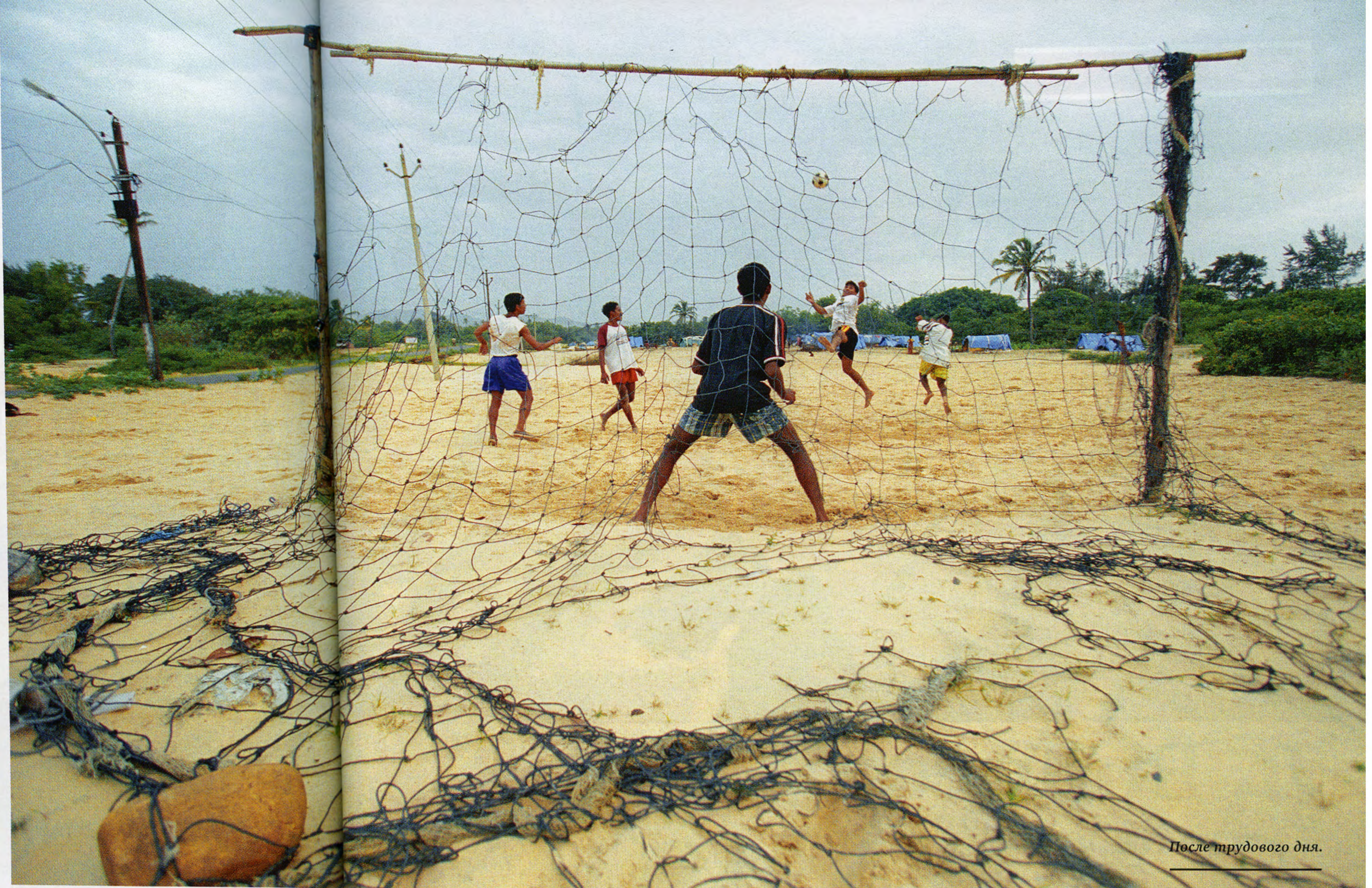
После трудового дня.