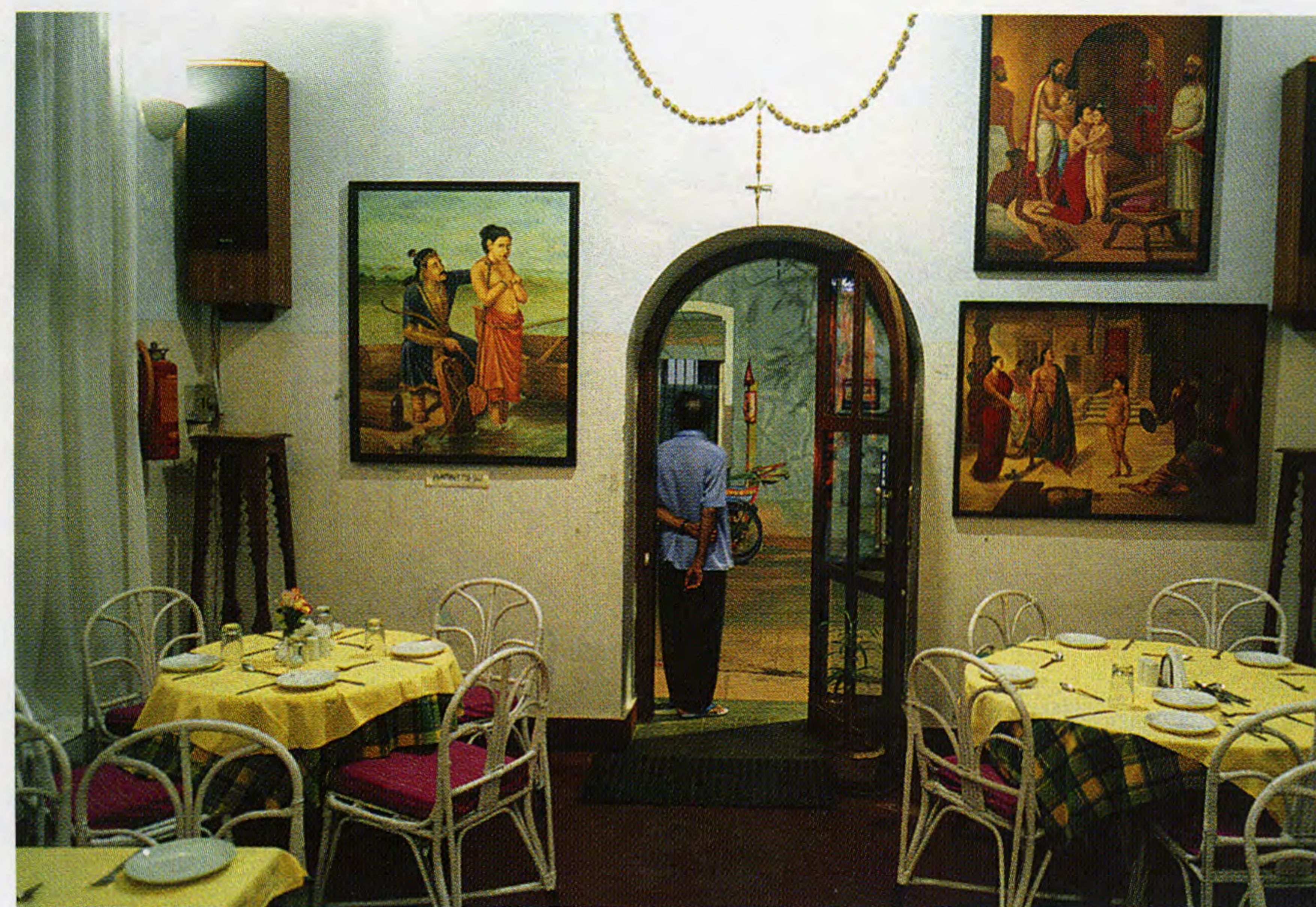
Кафе в португальском квартале в Гоа.