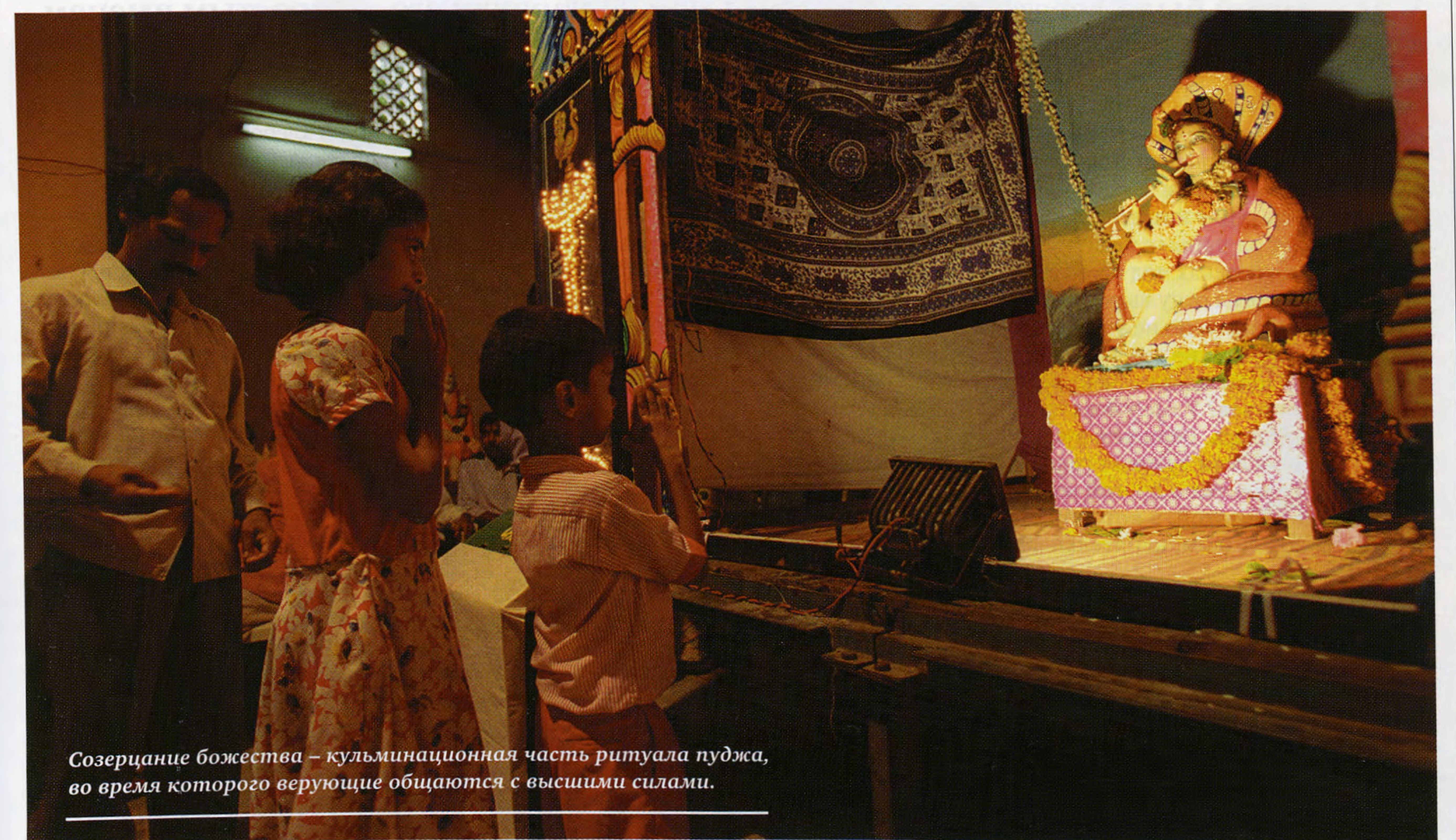
Созерцание божества – кульминационная часть ритуала пуджа, во время которого верующие общаются с высшими силами.