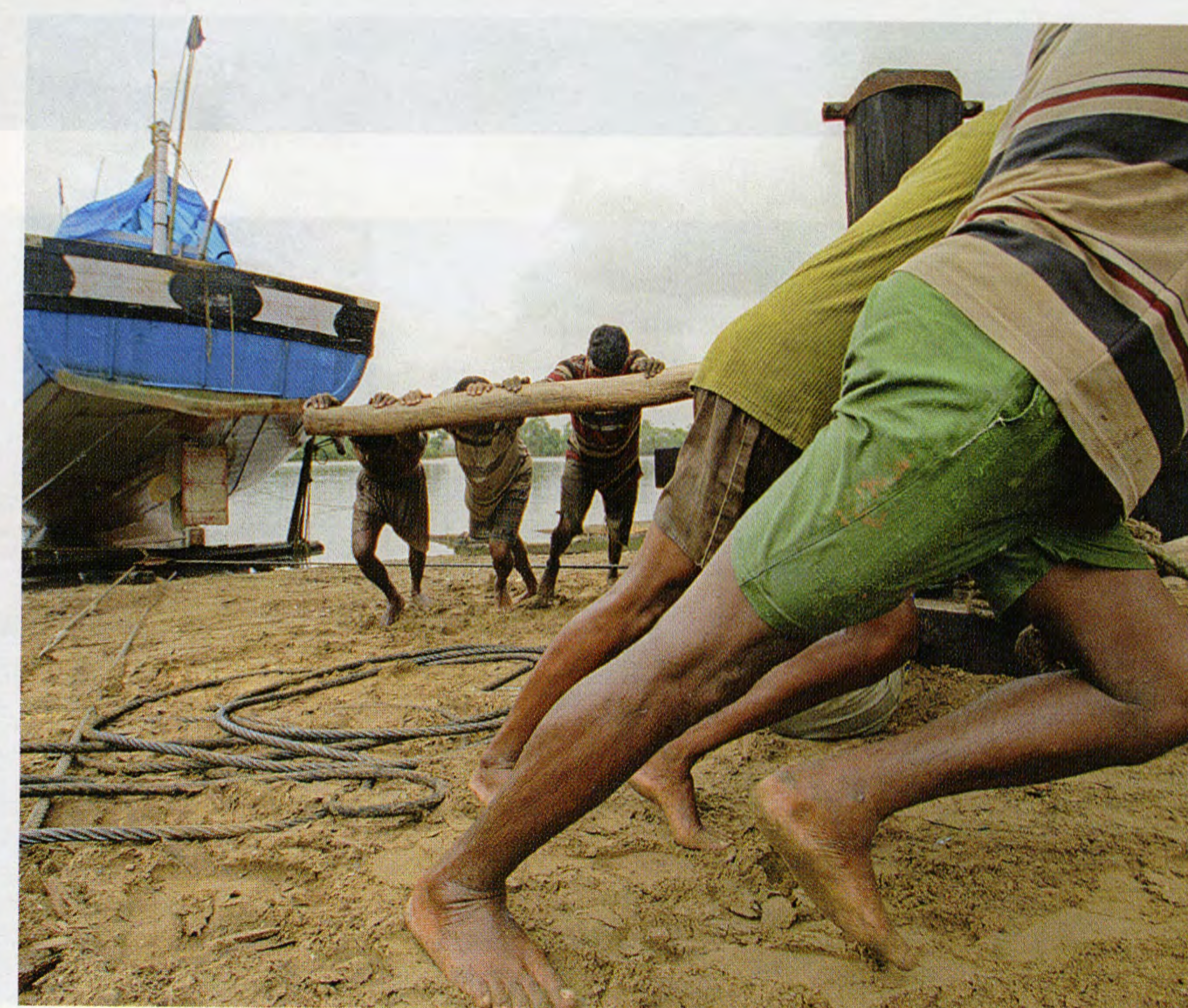
Бурлаки на Ганге.

Помечтать об Индии нам помогли фоторепортеры Сергей Максимишин, Алексей Нагаев и Дмитрий Чеботаев.