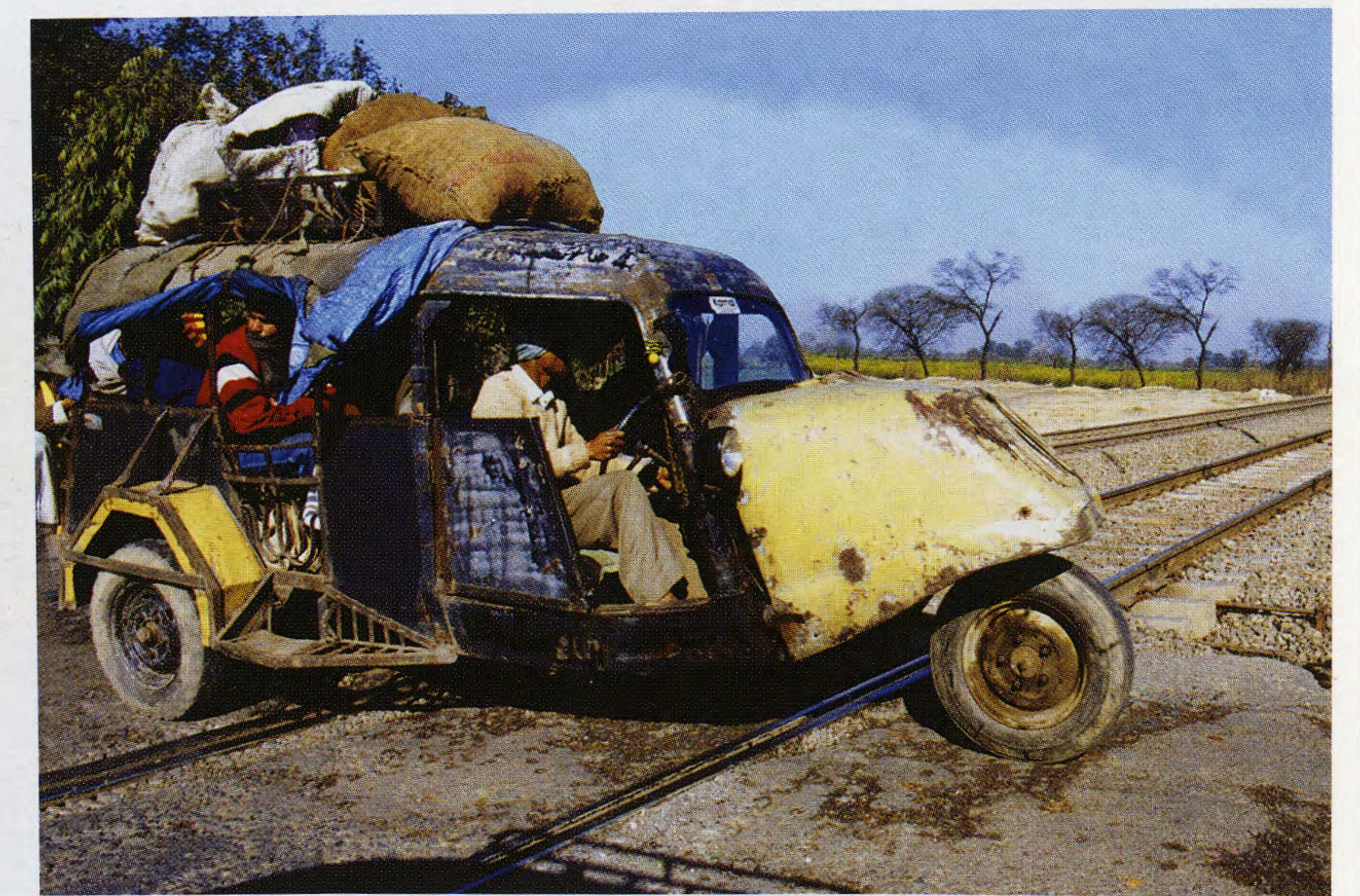
Поездка на моторишке обойдется в два раза дешевле, чем на такси, а за счет своего размера он передвигается намного быстрее по индийским дорогам.