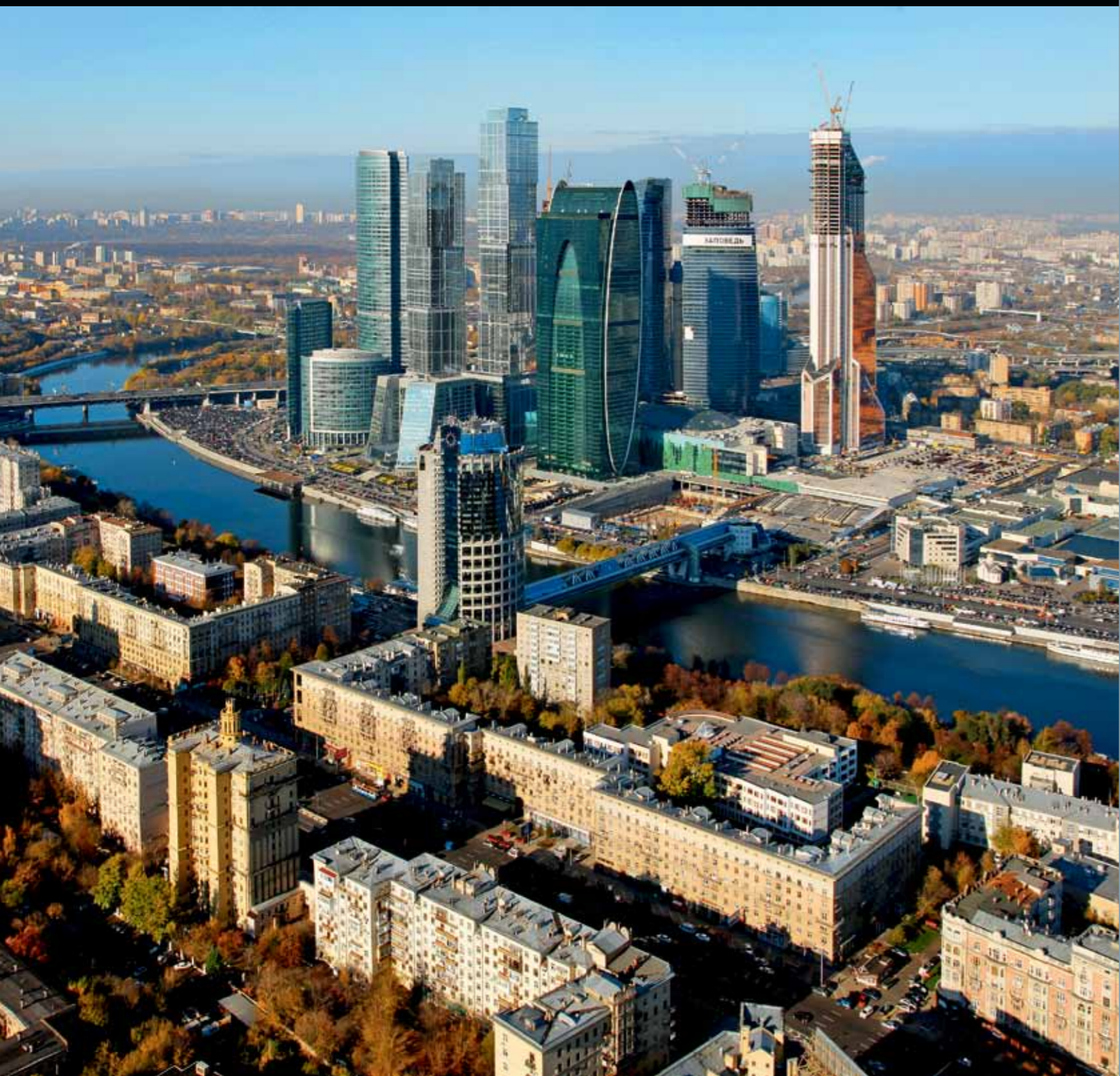
Деловой центр «Москва-сити» возводится на месте бывшей каменоломни, где в XV веке добывали материал для строительства Белого города. Здесь, по расчетам архитекторов, будут находиться высочайшие здания в Европе — 340-метровая «Меркурий Сити Тауэр» и комплекс башен «Федерация», высота шпиля которого достигнет 509 метров.