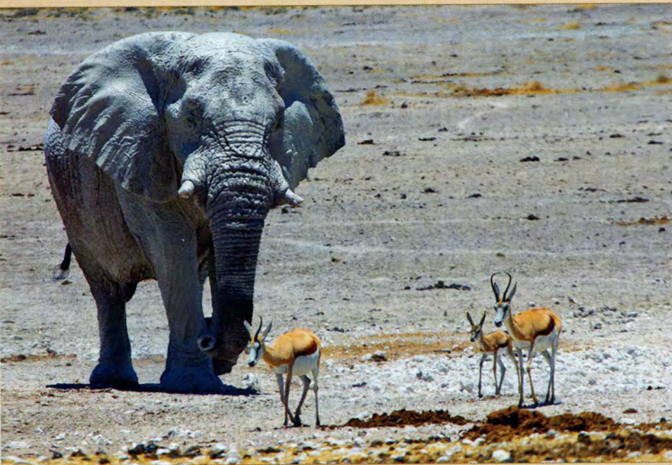
Слоны отлично уживаются со всеми обитателями парка Этоша