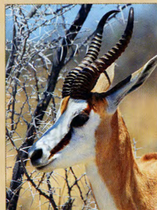
Другое название спрингбоков — антилопа-прыгун

ми барханами, где из растрескавшейся почвы торчат сухие стволы погибших еще 1000 лет назад деревьев, отбрасывающих угольные тени на красный, буквально кирпичного цвета (но начинающий уже блекнуть) песок. Здесь так сухо, что скелеты этих деревьев не гниют сотни лет. Через полчаса краски исчезают. Цвета пожуили. Белое солнце в белом небе. Начинается пекло. Я разворачиваюсь на 180 градусов — теперь путь на север.