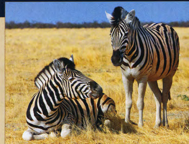
Рисунок полос каждой зебры уникален

ми — и ни одного животного. До заката часа два, пора как-то определиться с ночевкой. Спать в машине — ни малейшего желания. Еду в лагерь Халали, расположенный в сердце парка. На ресепшене шикарная мулатка. Жалуюсь ей на полное отсутствие носорогов. «О, сэр, их совсем, совсем мало осталось... Их убивают. Но они еще есть. Носороги днем не выходят, жарко, они активны ночью. Если хотите увидеть носорога, недалеко от лагеря есть водопой, они иногда