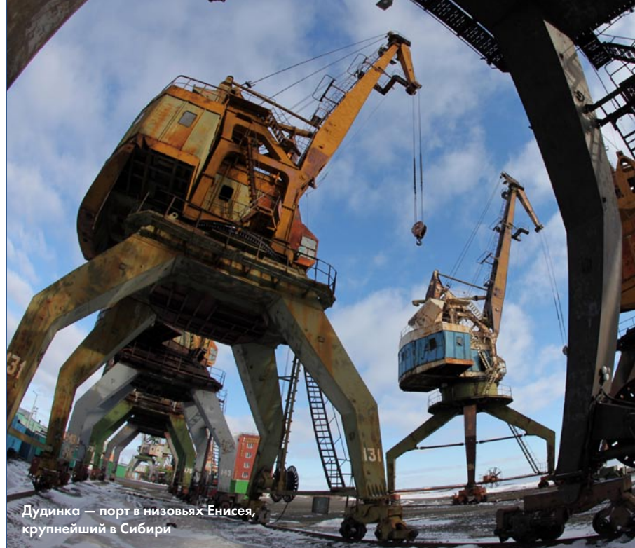
Дудинка — порт в низовьях Енисея, крупнейший в Сибири

Похоже, погода благоволит — идем на взлет. Под нами искрятся снега Таймыра. Винты вспарывают ледяной арктический воздух, пассажиры сонят по лавкам. Солнце печет.