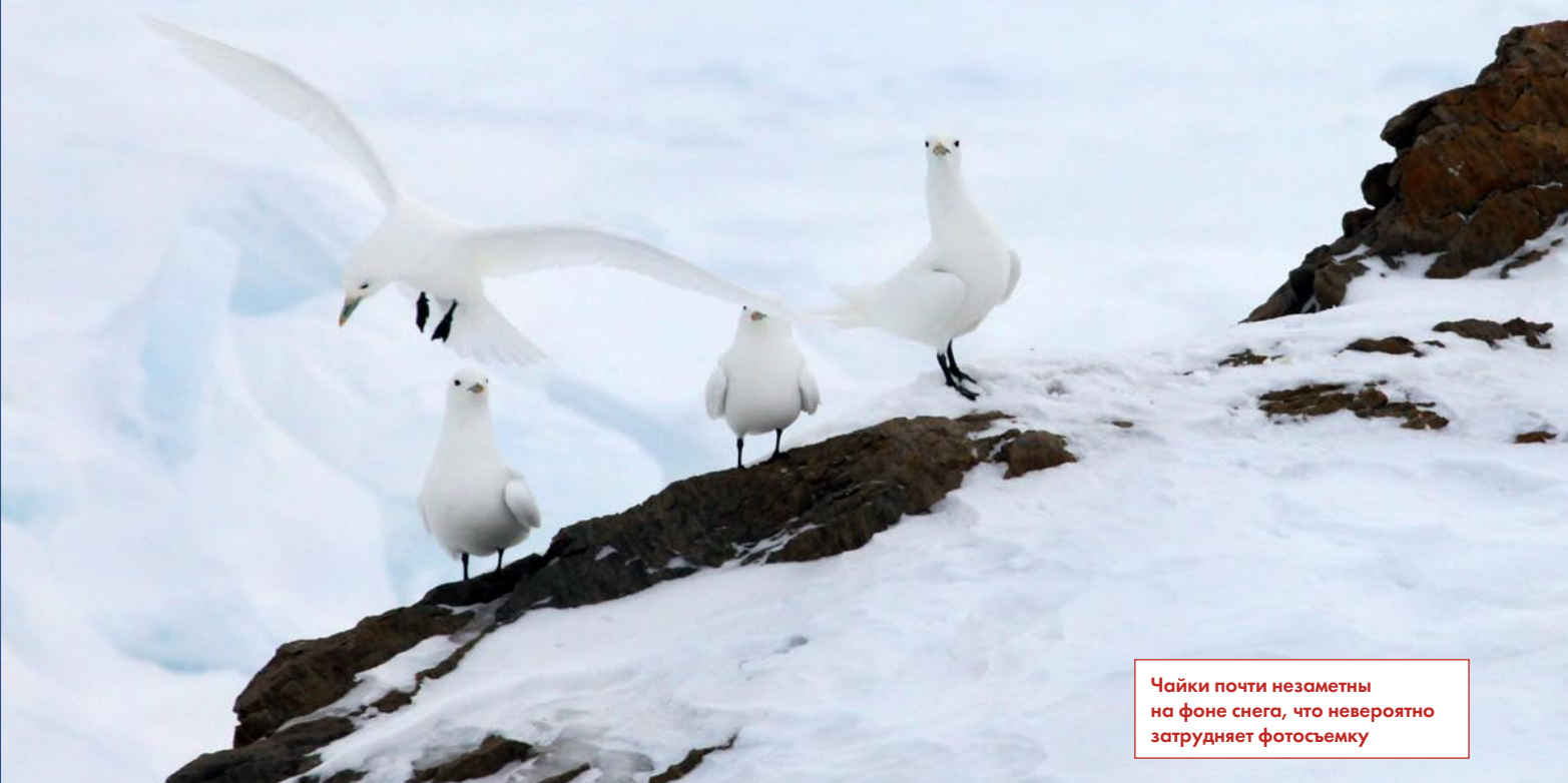
Чайки почти незаметны на фоне снега, что невероятно затрудняет фотосъемку