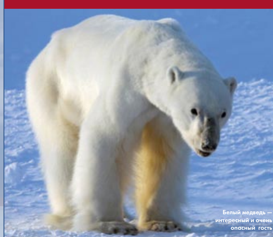
Белый медведь — интересный и очень опасный гость

нокль или в телеобъектив отсюда. Ребята очень просили не мешать им своим присутствием, находиться поодаль, чтобы зря не волновать птишек.