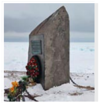
Исследователя Севера Георгия Ушакова похоронили на открытом им острове Домашний

НУЖНО РАЗВЕРНУТЬ И НАСТРОИТЬ ВСЕ ОБОРУДОВАНИЕ В РЕКОРДНЫЕ СРОКИ: САМОЛЕТ СТОИТ ТОЛЬКО ДО УТРА