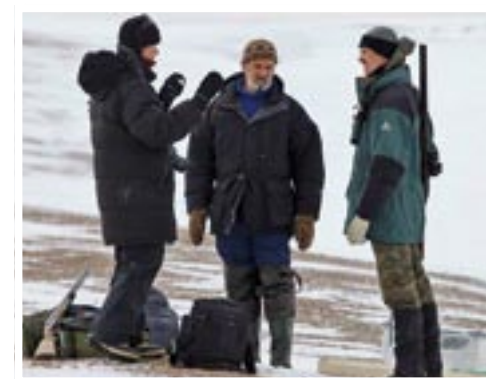
Орнитологи обсуждают результаты исследований

СОЛНЦЕ ЗДЕСЬ УЖЕ НЕ ЗАХОДИТ, ПРОСТО СПУСКАЕТСЯ ПОНИЖЕ К ГОРИЗОНТУ — НАСТАЛ ПОЛЯРНЫЙ ДЕНЬ