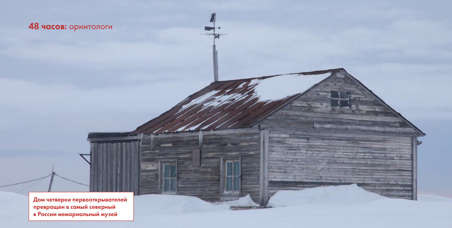
Дом четверки первооткрывателей превращен в самый северный в России мемориальный музей