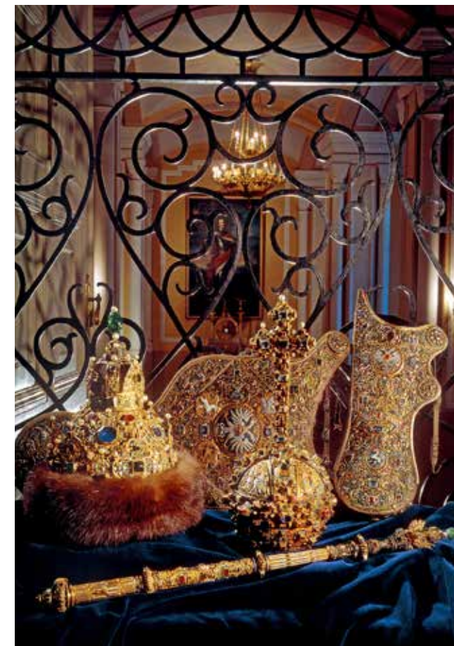
Ⓢ Регалии династии Романовых