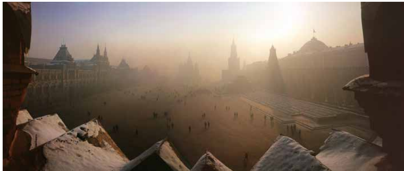
⊙ Красная площадь в -30^{\circ}\text{C} . 1976 год

главных секретов, почему его альбомы столь любимы москвичами.