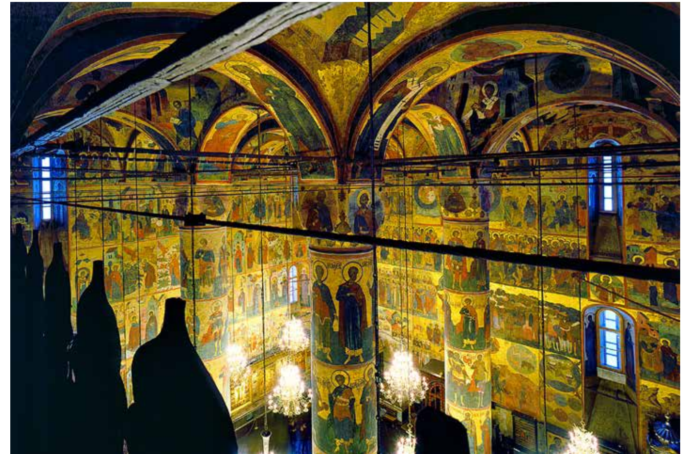
Ⓢ Фрески Успенского собора