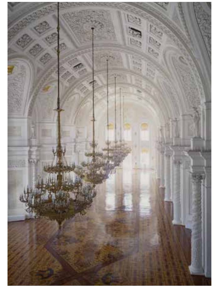
⊙ Георгиевский зал Большого Кремлёвского дворца