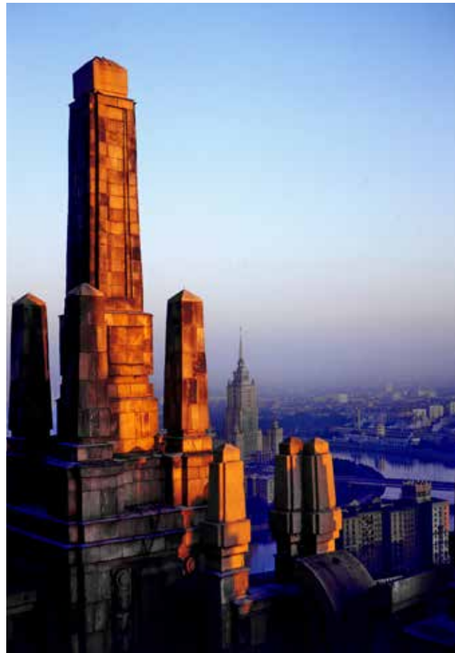
Ⓢ Рассвет над Москвой с вышки МИДа