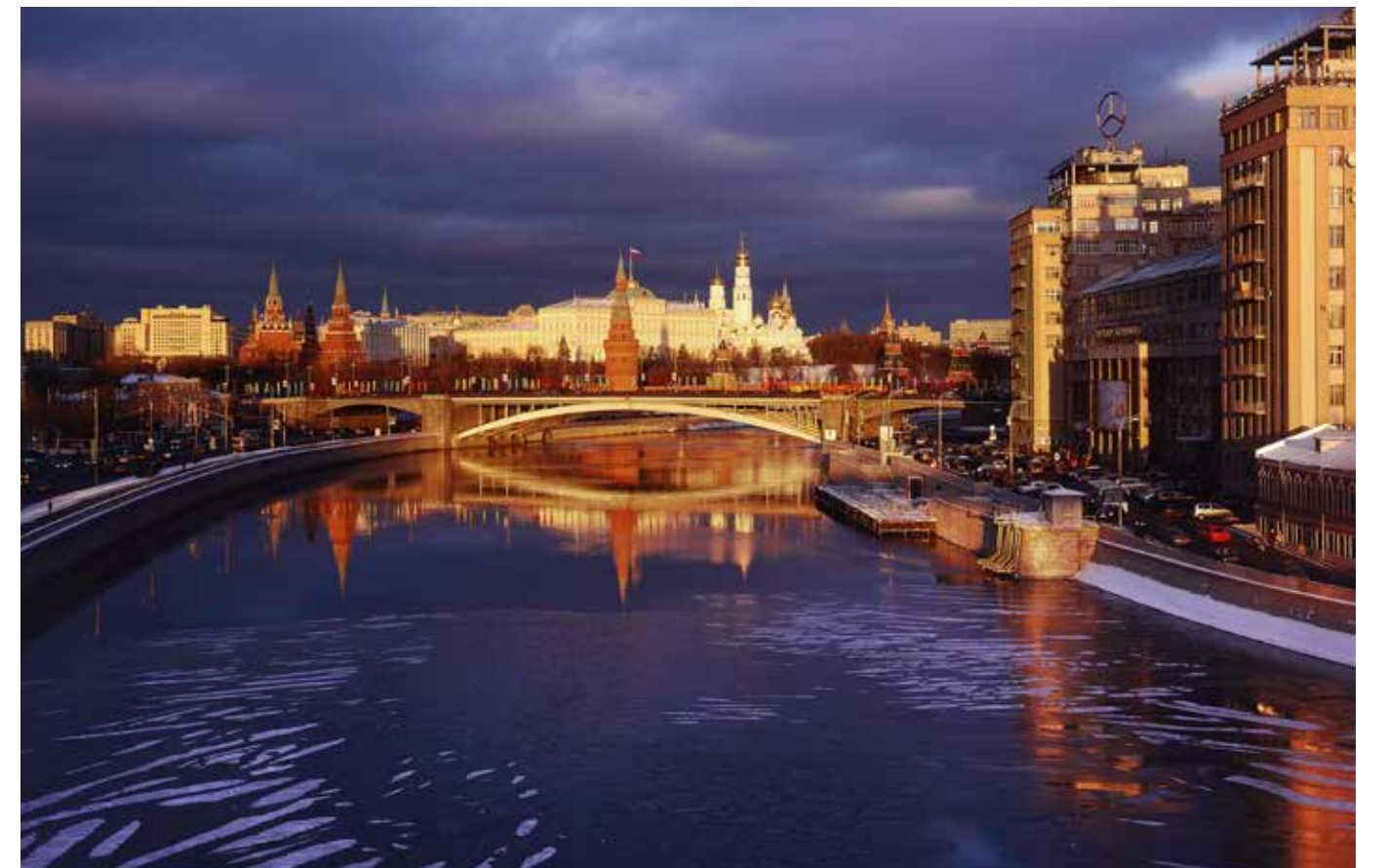
© Вид на Кремль. 2009 год