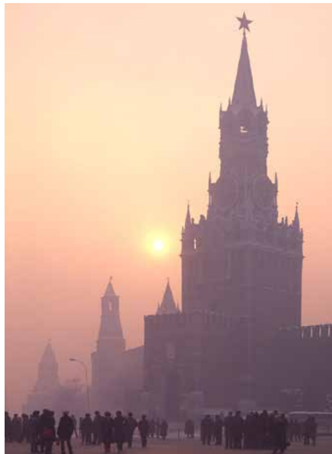
⊙ Красная площадь