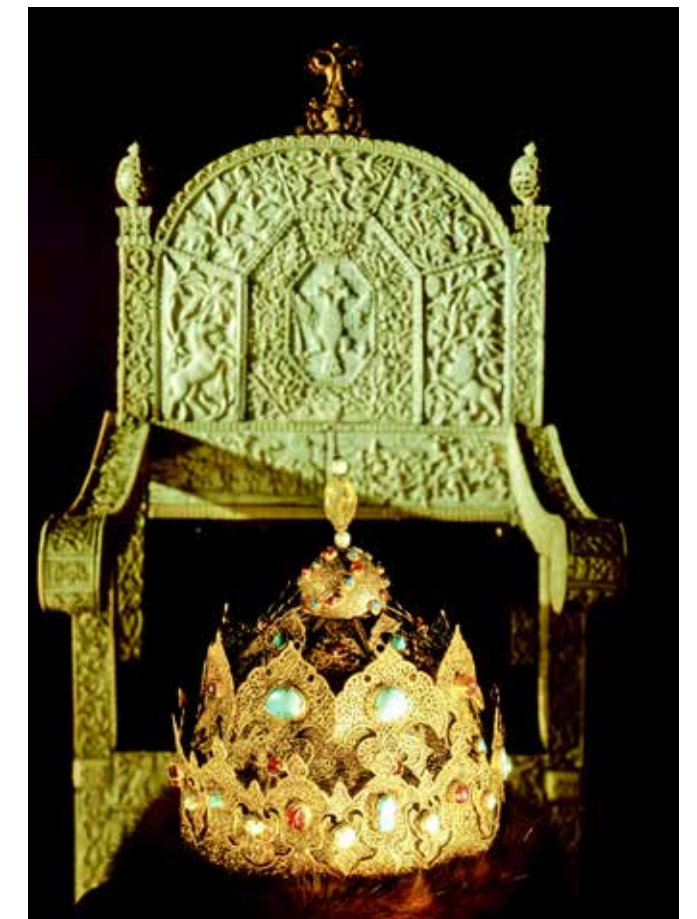
Ⓢ Трон Ивана Грозного и Казанская шапка