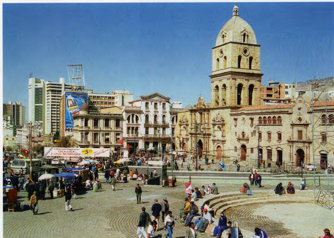
В боливийских городах колониальная архитектура причудливым образом сочетается с современными зданиями (вверху); боливийцы очень любят ходить в национальной одежде (внизу)